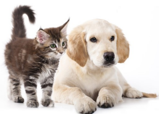
1.4 x 8.5 mm