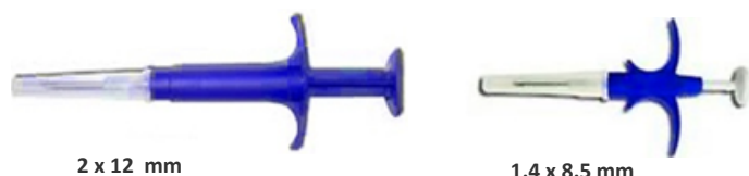
2 x 12 mm

Il est disponible pour les microchips 12 mm et 8.5 mm